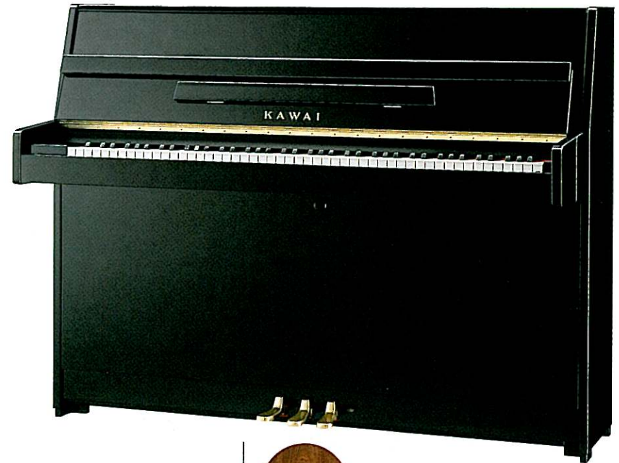
KX-10 Upright Piano