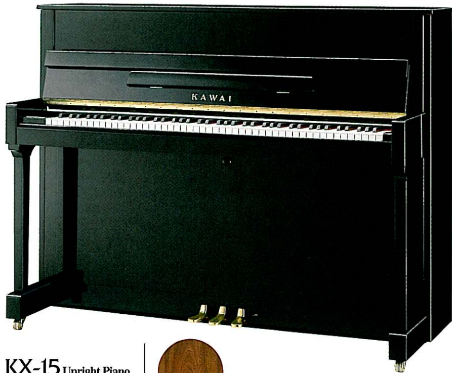
KX-15 Upright Piano